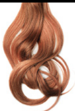
3/00 Castaño Oscuro