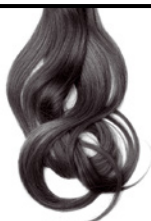
1/00 Negro Natural