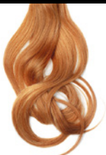
5/00 Castaño Claro