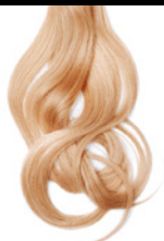
9/00 Rubio Extra Claro