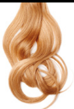
7/00 Rubio Claro